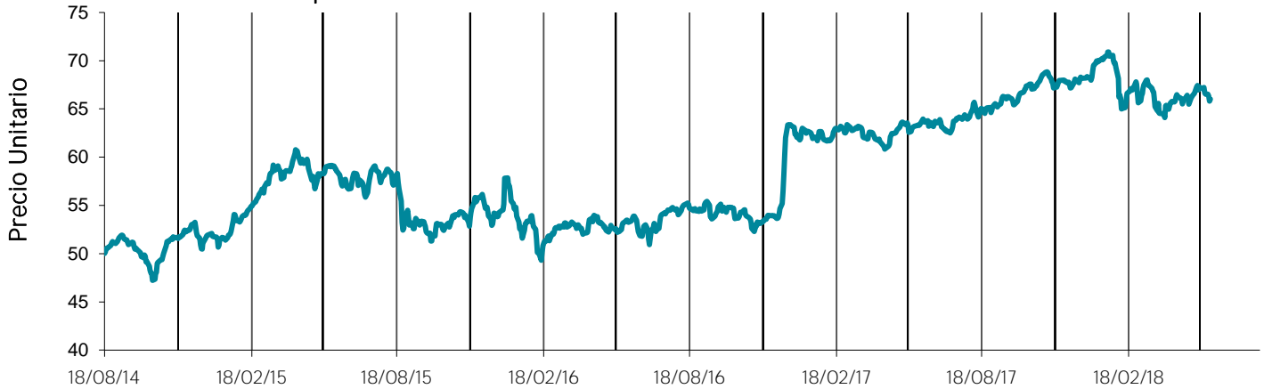
Evolución del precio unitario desde su fecha de emisión