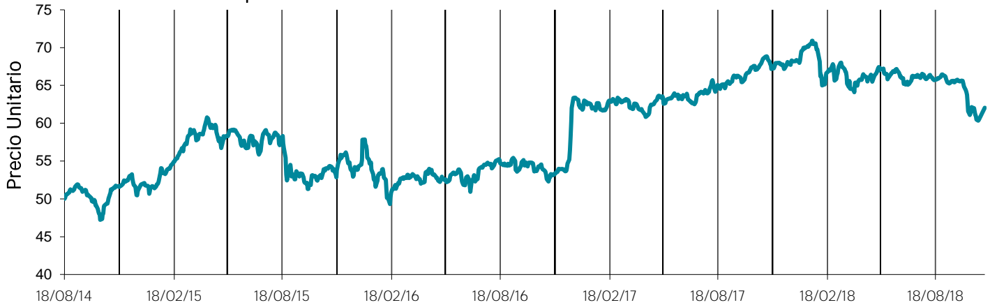
Evolución del precio unitario desde su fecha de emisión