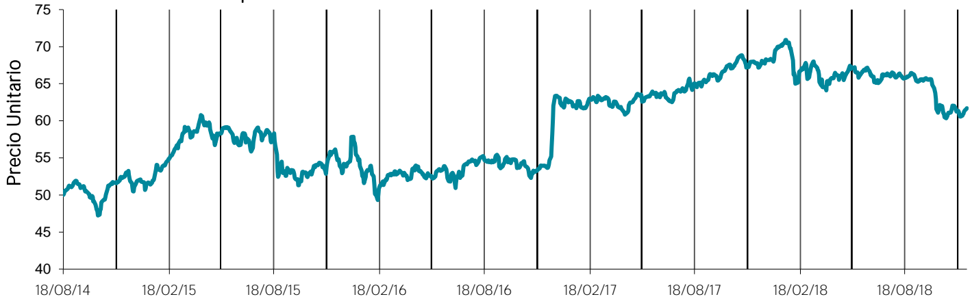
Evolución del precio unitario desde su fecha de emisión