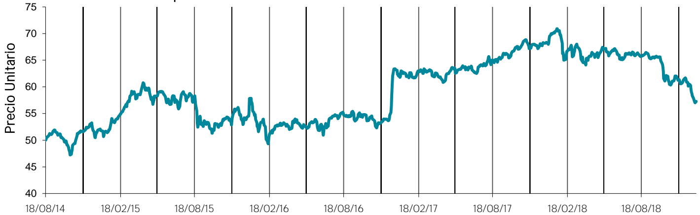
Evolución del precio unitario desde su fecha de emisión